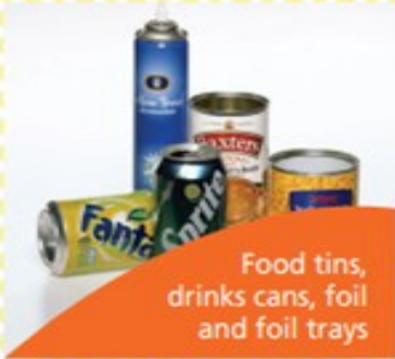
Food tins, drinks cans, foil and foil trays