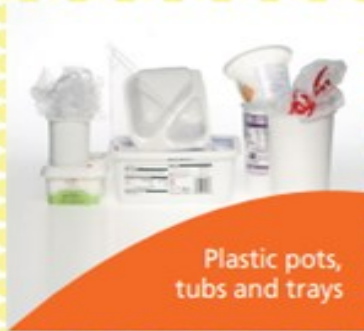
Plastic pots, tubs and trays