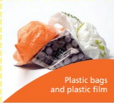
Plastic bags and plastic film

Please make sure your items are rinsed and do not contain any food. Only put the recyclable items above into your orange bags or communal recycling bin. Bags or bins with non-recyclable items cannot be collected.