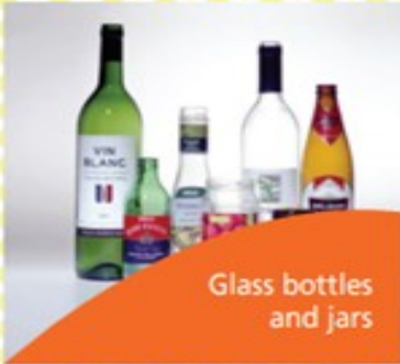
Glass bottles and jars