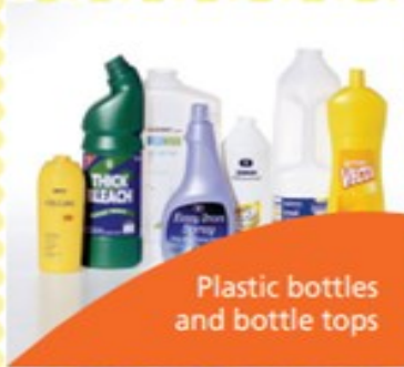
Plastic bottles and bottle tops