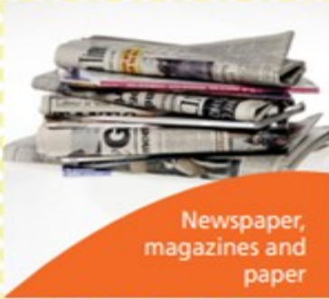
Newspaper, magazines and paper