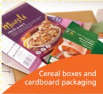
Cereal boxes and cardboard packaging