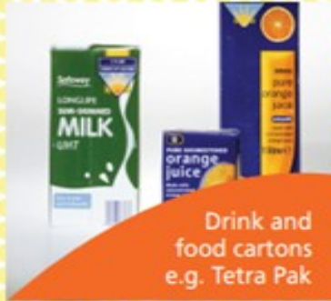
Drink and food cartons e.g. Tetra Pak