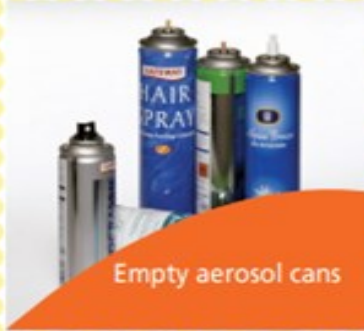
Empty aerosol cans